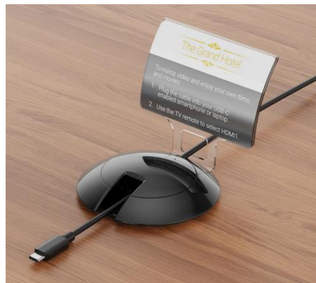
黒仕様ユニバーサルケーブルホルダー