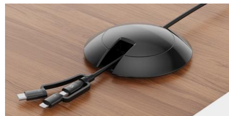
(別仕様) 3 in 1 充電ケーブル